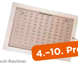
Karzi-Rachner Das Rechenlernspiel von HUSS