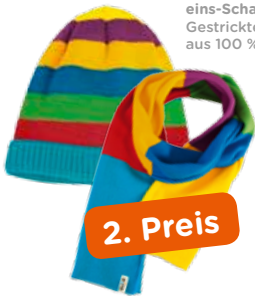
eins-Schal und Beanie Gestricktes Winterset aus 100 % Baumwolle