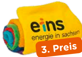
eins-Dusch-/Saunatuch Flauschiges Saunatuch von möve Größe: ca. 160 cm x 80 cm